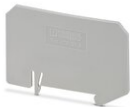
Placa separadora, longitud: 73,5 mm, anchura: 2 mm, altura: 47,2 mm, color: gris

Tenga en cuenta que los datos indicados aquí proceden del catálogo en línea. Los datos completos se encuentran en la documentación del usuario. Son válidas las condiciones generales de uso de las descargas por Internet. ( http://phoenixcontact.es/download )