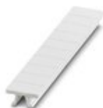
Tira Zack, disponible: Tiras, blanco, rotulado según las indicaciones del cliente, clase de montaje: encajar en ranura para índice alta, para ancho de borne: 5,2 mm, superficie útil: 5,15 x 10,5 mm, Número de índices individuales: 10

Tira Zack - ZB 5,LGS:FORTL.ZAHLEN - 1050017