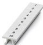
Tira Zack, blanco, Rotulación transversal: números correlativos de 1 ... 10, 11 ... 20 etc. hasta 491 ... 500, clase de montaje: encajar en ranura para índice alta, para ancho de borne: 5,2 mm, superficie útil: 5,15 x 10,5 mm

Tira Zack - ZB 5,QR:FORTL.ZAHLEN - 1050020