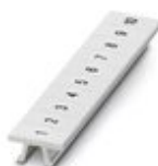
Tira Zack, Tiras, blanco, rotulado, rotulación longitudinal: números correlativos de 1 ... 10, 11 ... 20 etc. hasta 491 ... 500, clase de montaje: encajar en ranura para índice alta, para ancho de borne: 5,2 mm, superficie útil: 5,15 x 10,5 mm, Número de índices individuales: 10

Tira Zack - ZB 5,LGS:FORTL.ZAHLEN - 1050017