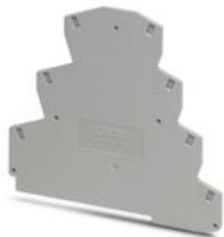
Tapa final, longitud: 104,5 mm, anchura: 2,2 mm, altura: 92,1 mm, color: gris

Tenga en cuenta que los datos indicados aquí proceden del catálogo en línea. Los datos completos se encuentran en la documentación del usuario. Son válidas las condiciones generales de uso de las descargas por Internet. ( http://phoenixcontact.es/download )