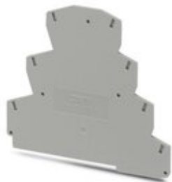
Tapa final, longitud: 99,5 mm, anchura: 2,2 mm, altura: 88 mm, color: gris

Tenga en cuenta que los datos indicados aquí proceden del catálogo en línea. Los datos completos se encuentran en la documentación del usuario. Son válidas las condiciones generales de uso de las descargas por Internet. ( http://phoenixcontact.es/download )