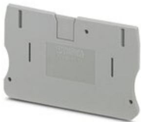
Tapa final, longitud: 67,7 mm, anchura: 2,2 mm, altura: 42,6 mm, color: gris

Tenga en cuenta que los datos indicados aquí proceden del catálogo en línea. Los datos completos se encuentran en la documentación del usuario. Son válidas las condiciones generales de uso de las descargas por Internet. ( http://phoenixcontact.es/download )