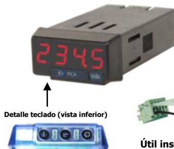
Detalle teclado (vista inferior)